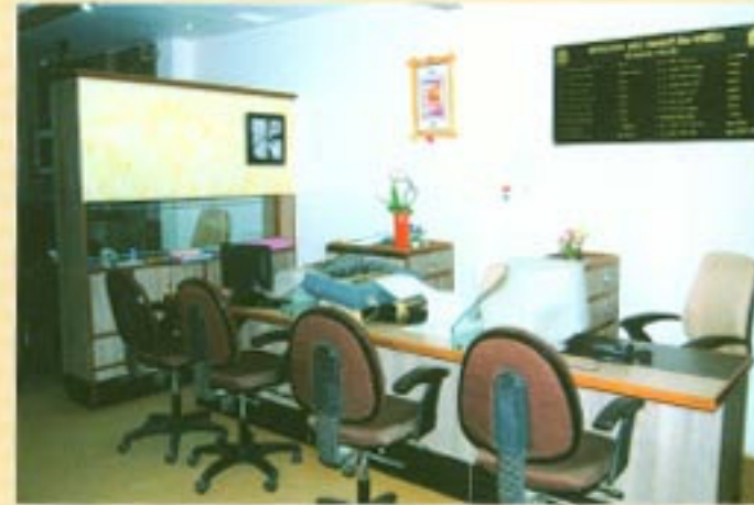
मार्केटगार्ड शाखा स्थलांतरीत कार्यालयाची अंतर्गत सजावट.