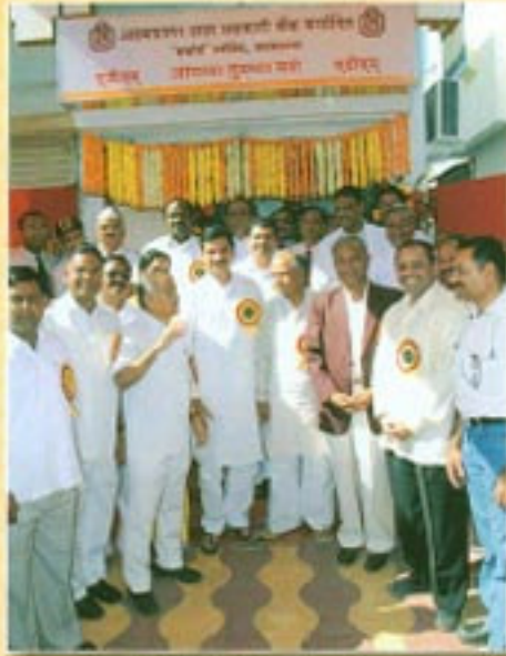
बँकेच्या प्रॉजेक्ट्स कॉलनी परिसरातील, श्री. समर्थ प्रहाससंगोरील ऑफ-साईट ए.टी.एम्. सेंट्रलच्या उद्घाटन कार्यक्रमास उपस्थित मा. मा. श्री. बाळासाहेब थोरात, कृषिमंत्री, महाराष्ट्र राज्य.