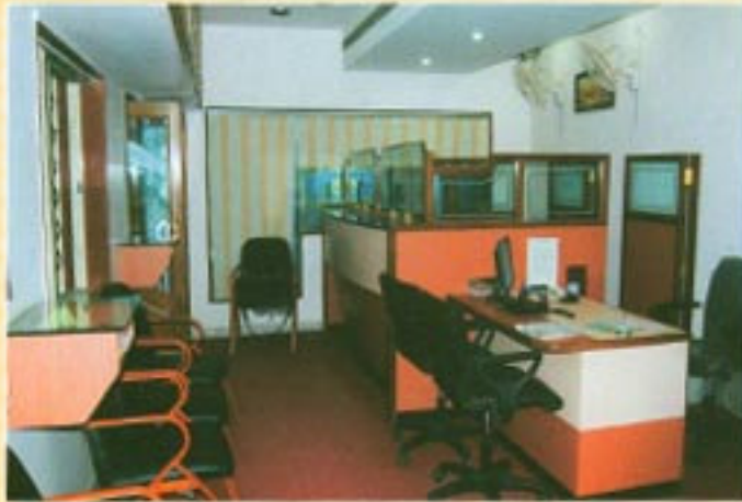
मनभाडरोड शाखा विस्तारीत कार्यालयाची अंतर्गत सजावट.