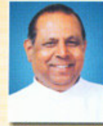
डॉ. रावसाहेब अनभुले