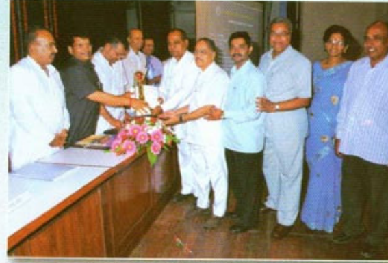
दि महाराष्ट्र स्टेट को-ऑप बँक्स असो. लि., मुंबई यांचे वतीने कै. पद्मभूषण वसंतदादा पाटील उत्कृष्ट नागरी सहकारी बँक पुरस्कार, वनमंत्री नामदार बबनराव पाचपुते यांच्या हस्ते स्वीकारतांना.