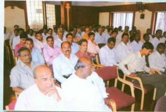
प्रशिक्षणामध्ये मग्न असलेला कर्मचारी वर्ग.