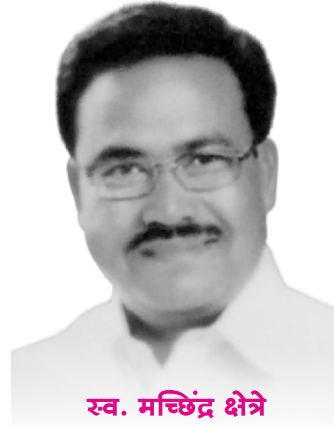
स्व. मच्छिंद्र क्षेत्रे संचालक (कार्यकाळ : १९८८ ते २०२२)